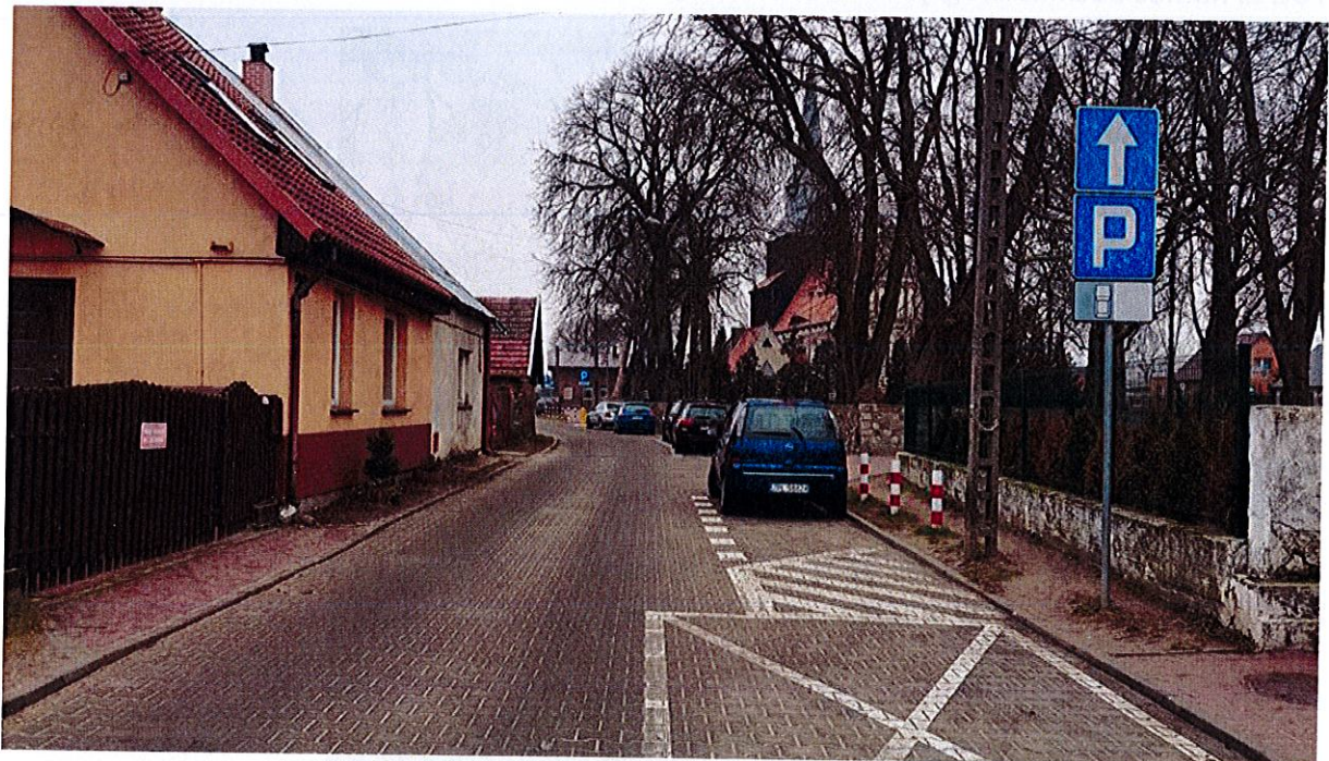
Fot. 1. Początek drogi jednokierunkowej.