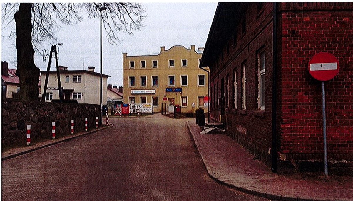
Fot. 2. Koniec odcinka drogi jednokierunkowej.