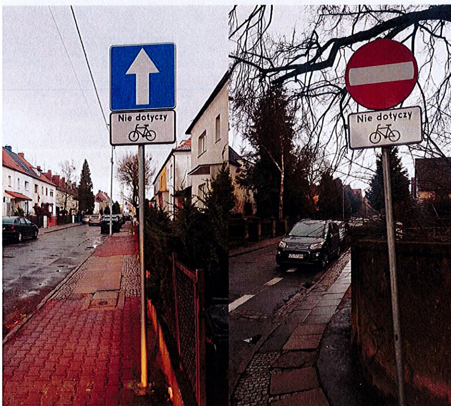
Fot. 3 i 4. Zastosowanie znaku T-22 w połączeniu ze znakami D-3 oraz B-2 w Szczecinie