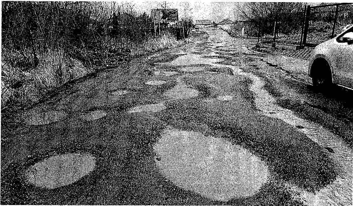
Fot. 1. Mierzyn, ul. Promienista