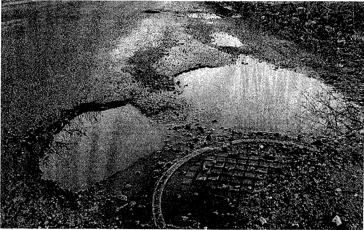
Fot. 2. Mierzyn, ul. Zgodna