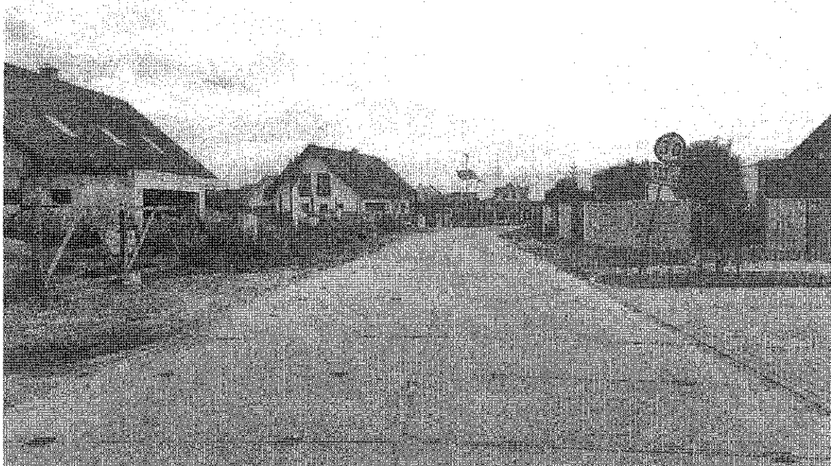
Fot. 1. Ul. Kolorowa w Mierzynie (stan na dzień 27.07.2023 r.)