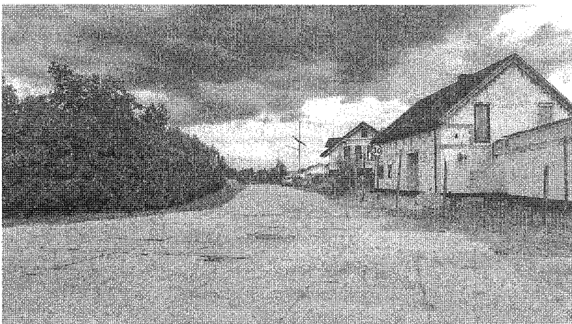
Fot. 2. Ul. Rolnicza w Mierzynie (stan na dzień 27.07.2023 r.)