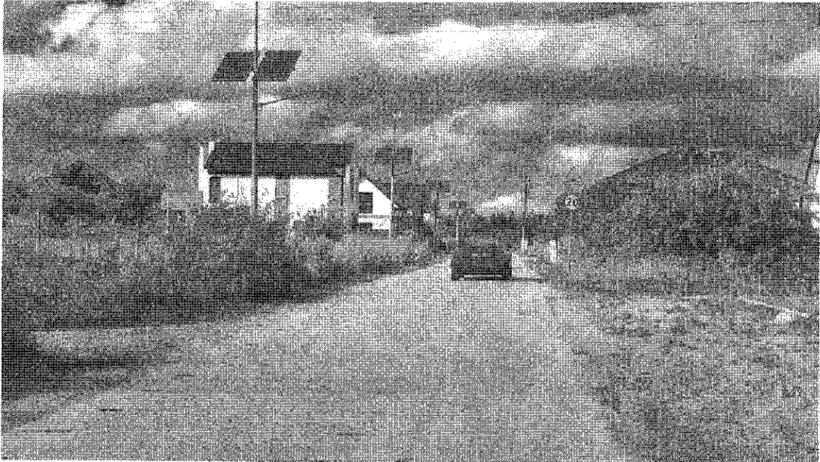
Fot. 5. Ul. Rolnicza w Mierzynie (stan na dzień 28.07.2023 r.)