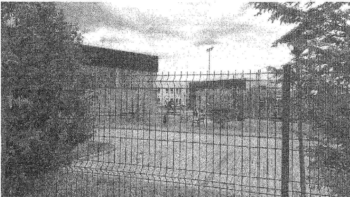
Fot. 2. Brak możliwości korzystania ze szkolnego terenu sportowego oraz szkolnego placu zabaw w PSP w Mierzynie (stan na dzień 27.07.2023 r., godz. 15:42)