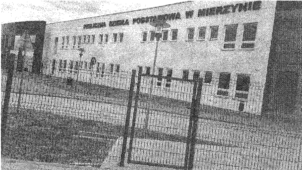
Zamknięta furtka wejściowa na teren PSP w Mierzynie (stan na dzień 27.07.2023 r., godz. 15:43)