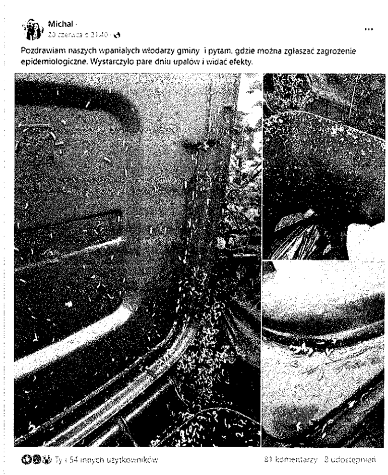
Fot. 2. Wpis na grupie „Bezrzecze Wołczkowo Redlica - co nowego?” (Facebook)