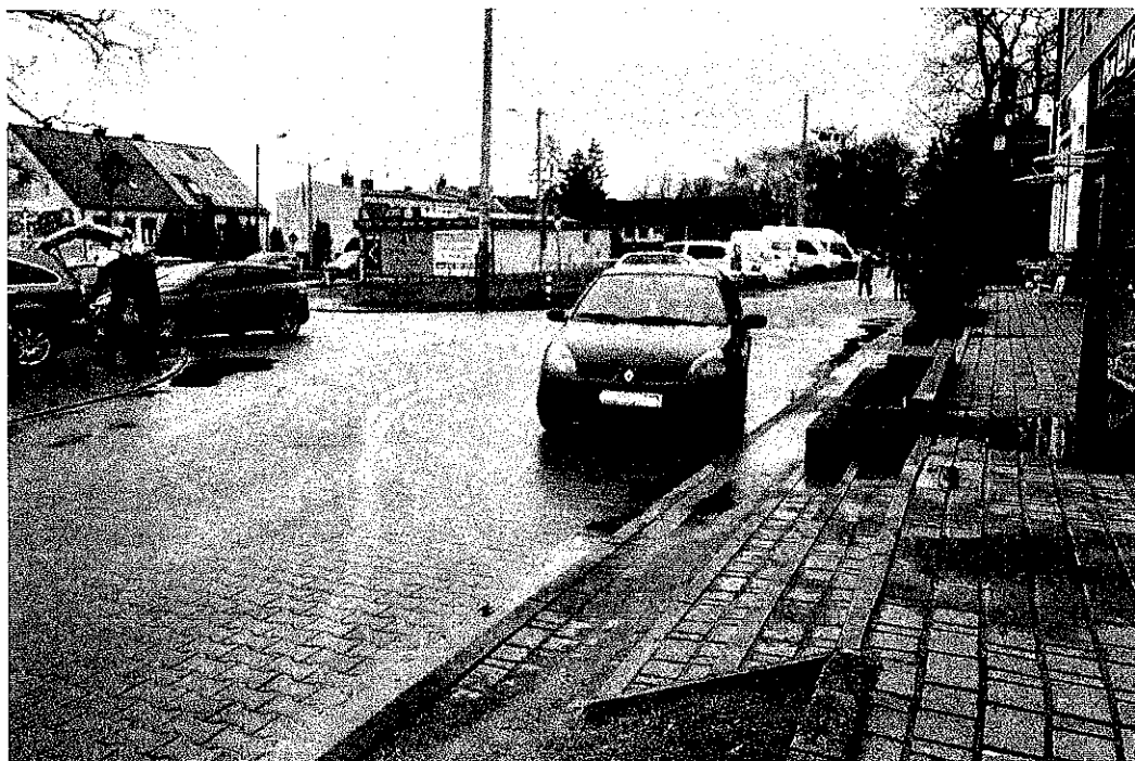
Fot. 1. Samochód parkujący przy ul. Weleckiej 38 w dniu 1.04.2023 r.