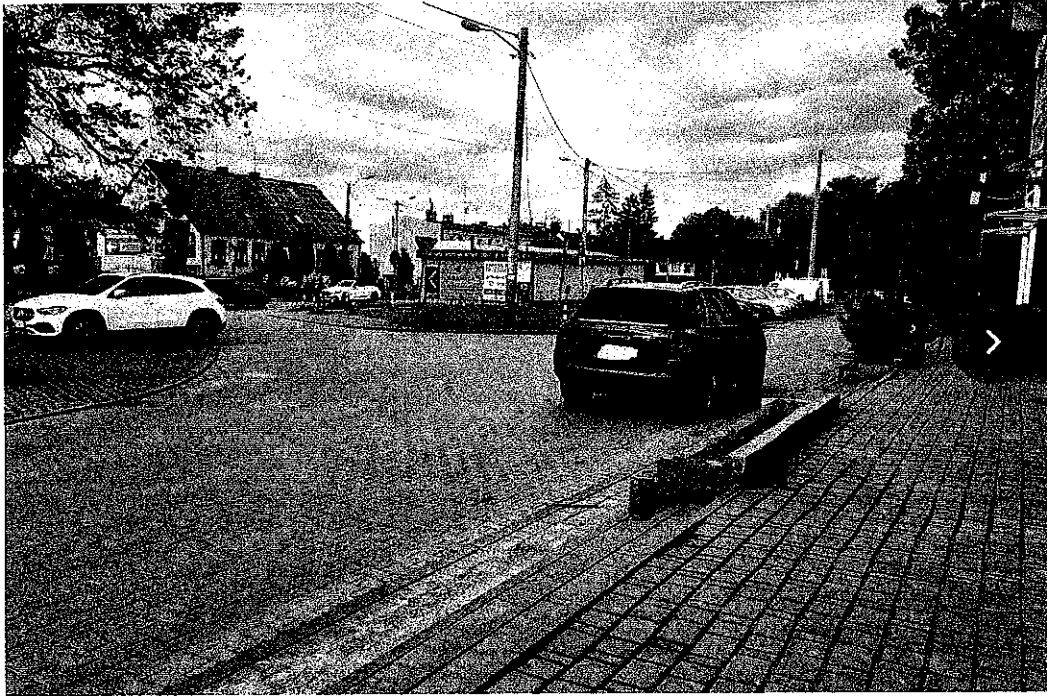
Fot. 2. Samochód parkujący przy ul. Weleckiej 38 w dniu 9.07.2022 r.