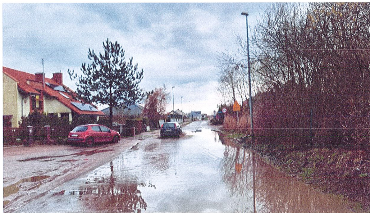
Fot. 4. Ulica Zeusa na wysokości posesji 13 - 15 (stan na dzień 30.03.2023 r.)