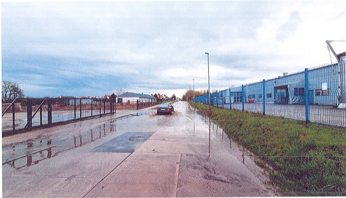
Fot. 5. Ulica Zeusa na wysokości wjazdu na parking firmy AwaMed (stan na dzień 30.03.2023 r.)