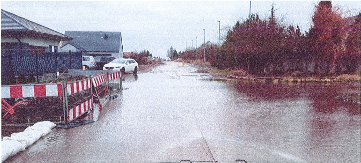
Fot. 1. Skrzyżowanie ulic Zeusa oraz Na Olimpie w Mierzynie (stan na dzień 6.02.2022 r.)