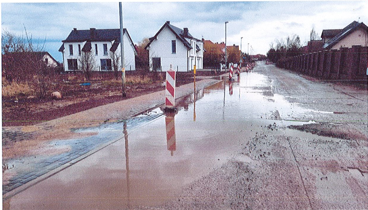
Fot. 6. Okolice skrzyżowania ulic Zeusa i Wenus (stan na dzień 30.03.2023 r.)