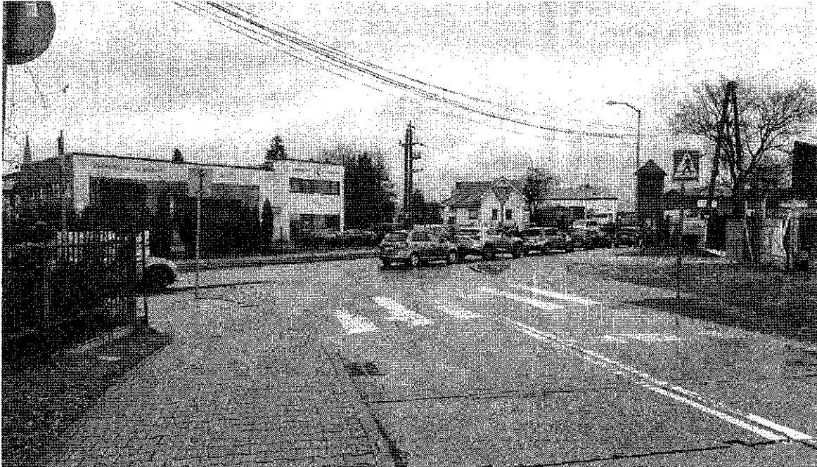
Zdjęcie nr 1. Lokalizacja przejścia dla pieszych, które jest przedmiotem tej interpelacji (wykonane przez autora interpelacji w dniu 16.02.2021 r.)