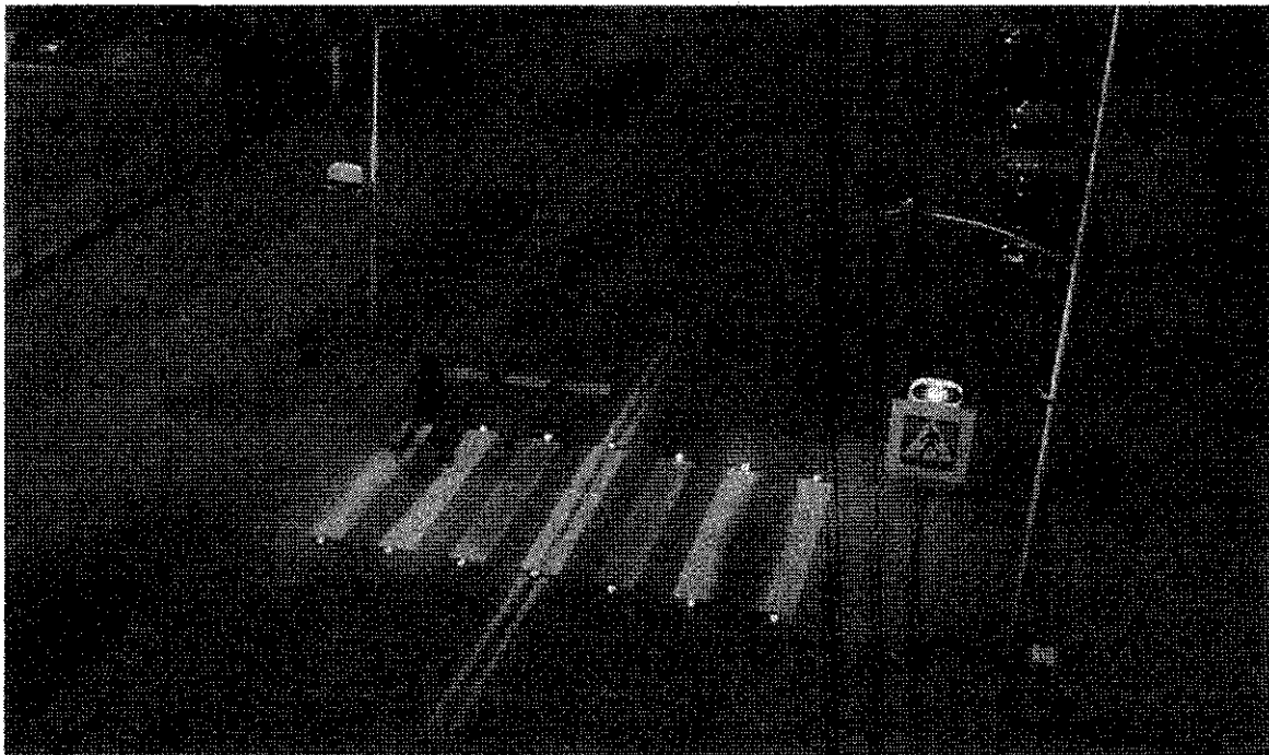
Zdjęcie nr 2. Materiał z filmu „SmartPass - inteligentne przejście dla pieszych” (źródło: https://smartpass.city/pl/smartpass )