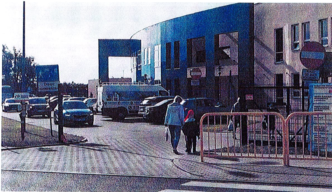
Fot. 3. Rodzice z dziećmi wchodzą na teren szkoły przez bramę wyjazdową dla samochodów (zdjęcie autora interpelacji z dnia 1.06.2021 roku).