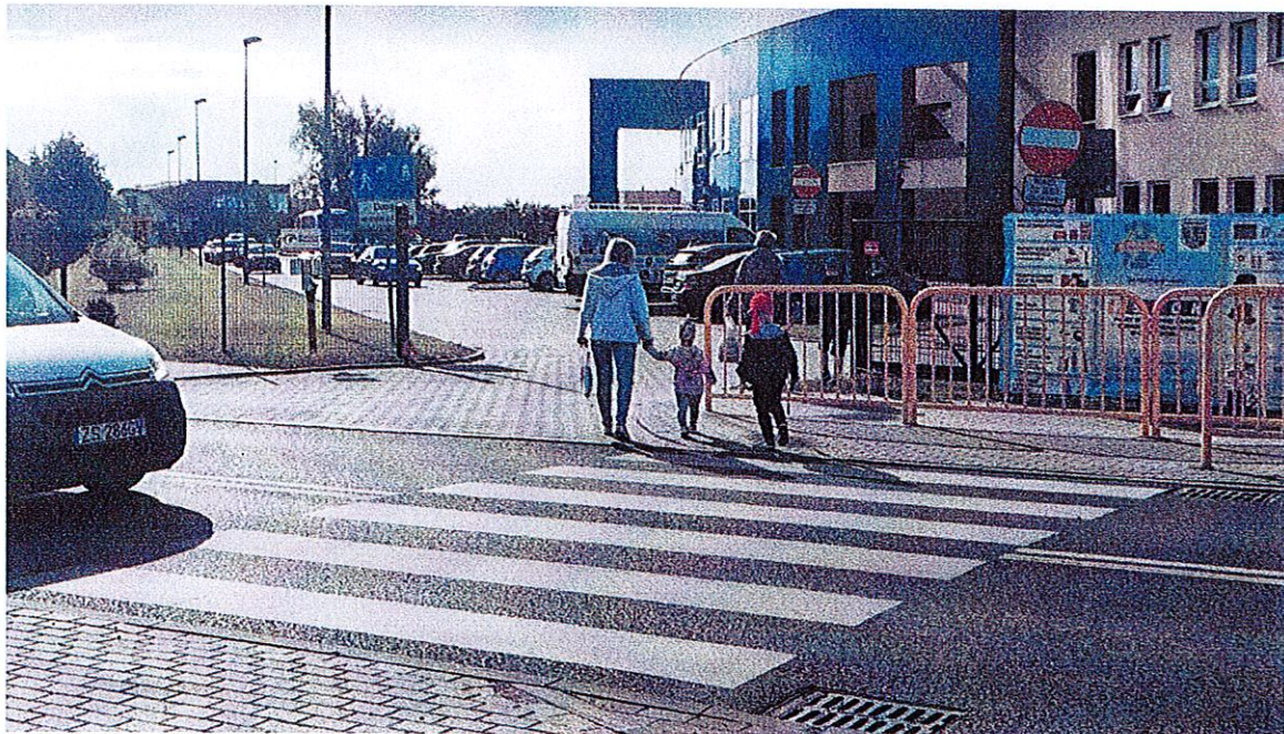
Fot. 2. Rodzice z dziećmi idący do szkoły przechodzą przez przejście dla pieszych na ulicy Długiej.

(zdjęcie autora interpelacji z dnia 1.06.2021 roku).