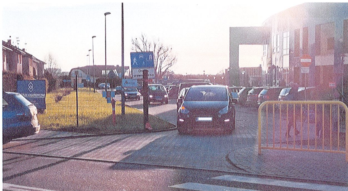
Fot. 4. Dziecko z rodzicem wchodzi na teren szkoły przez bramę wyjazdową dla samochodów.