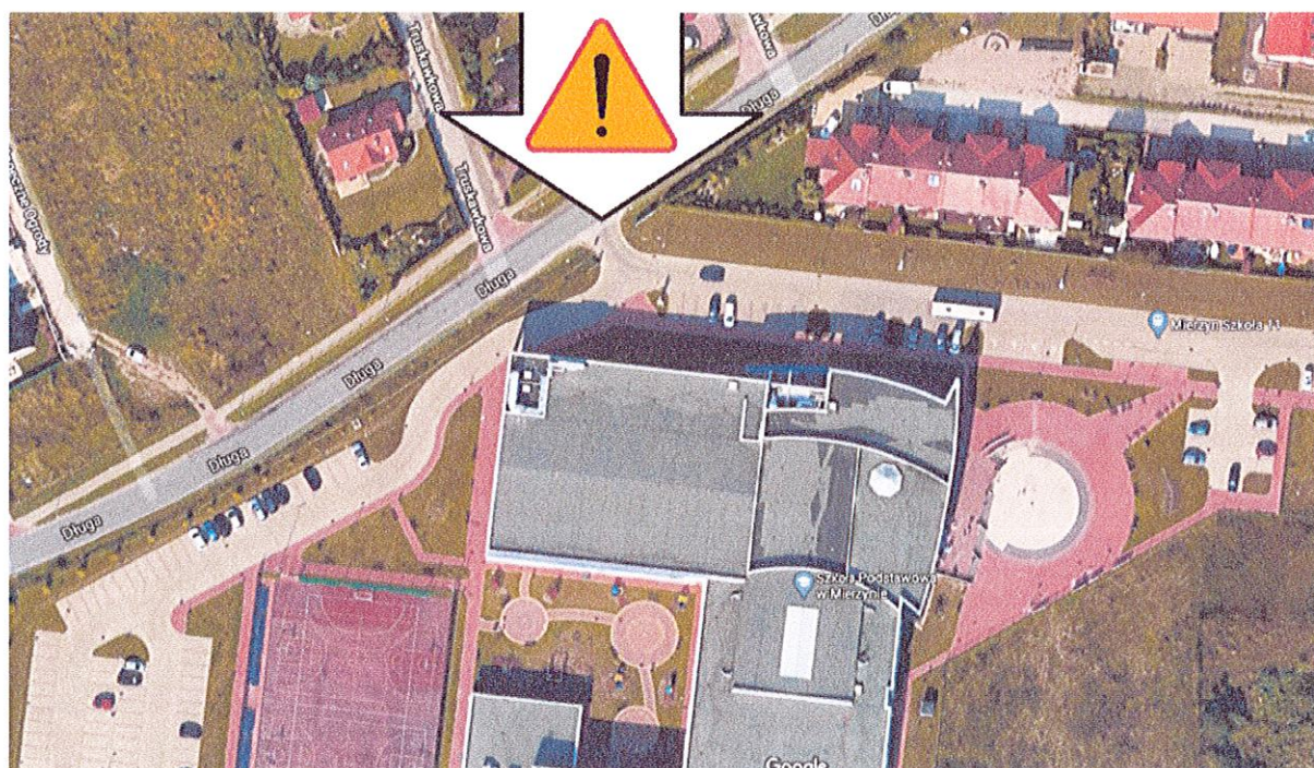
Fot. 1. Niebezpieczne miejsce w którym dzieci przeciskają się między samochodami (mapa: www.google.pl/map )