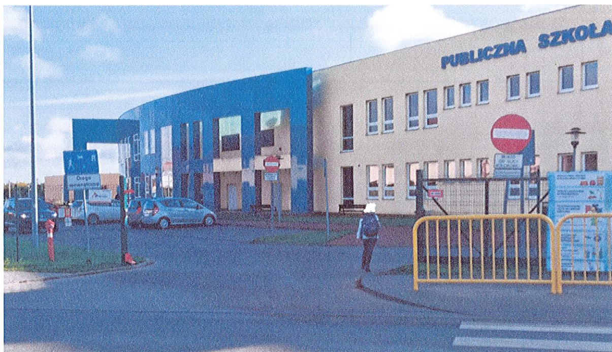
Fot. 3. Dziecko wchodzi na teren szkoły przez bramę wyjazdową dla samochodów (zdjęcie autora interpelacji z dnia 5.11.2020 roku).