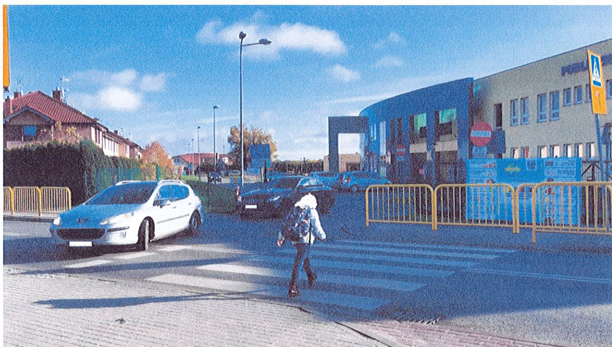
Fot. 2. Dziecko idące do szkoły przechodzi przez przejście dla pieszych na ulicy Długiej (zdjęcie autora interpelacji z dnia 5.11.2020 roku).