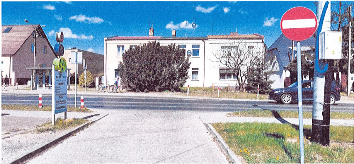
fot. 5 Znak B-2 pod którym proponuję umieścić tabliczkę T-22.