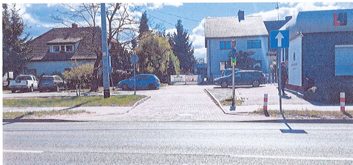
fot. 4 Znak C-3 pod którym proponuję umieścić tabliczkę T-22.