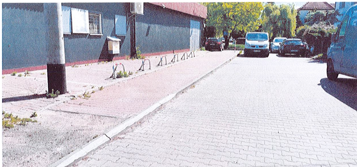
fot. 7 Fragment chodnika na którym proponuję dopuścić ruch rowerowy.