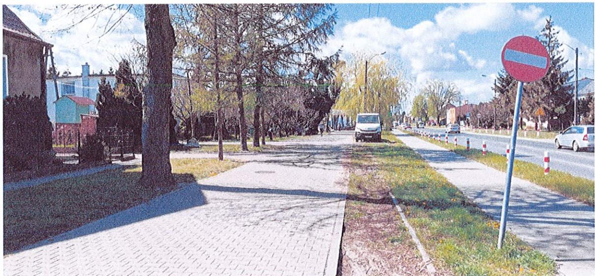
fot. 2 Znak B-2 pod którym proponuję umieścić tabliczkę T-22.