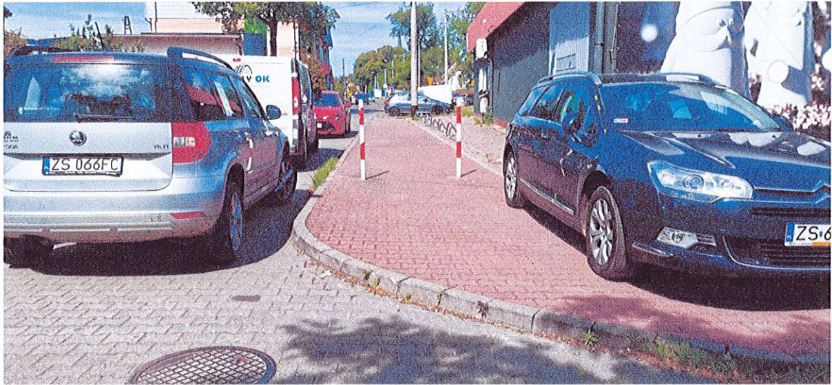
fot. 6 Fragment chodnika na którym proponuję dopuścić ruch rowerowy.