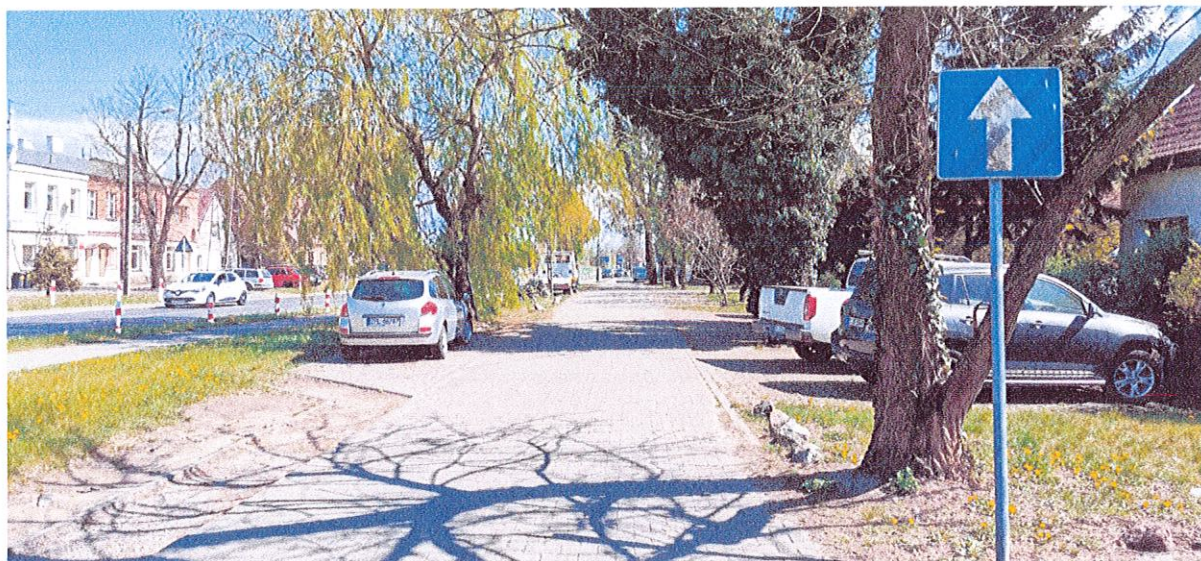
fot. 3 Znak C-3 pod którym proponuję umieścić tabliczkę T-22.