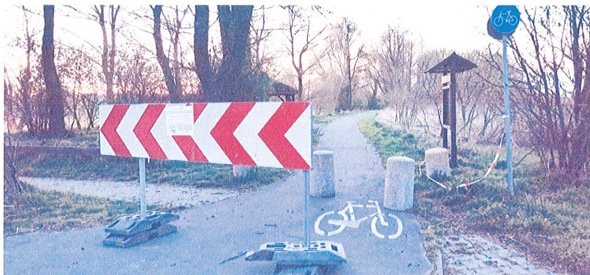
fot. 1. Wjazd od strony miejscowości Buk na fragment ścieżki będącej przedmiotem interpelacji